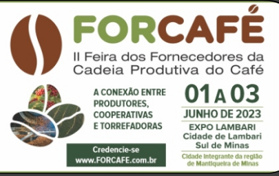
Localização / Número do Stand

Piso sob local, revestido em carpete na cor grafite 16,0m 2